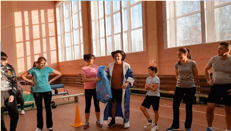
Веселые игры во время ожидания вердикта судей